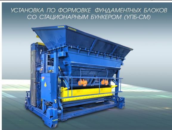
УСТАНОВКА ПО ФОРМОВКЕ ФУНДАМЕНТНЫХ БЛОКОВ СО СТАЦИОНАРНЫМ БУНКЕРОМ (УПБ-СМ)