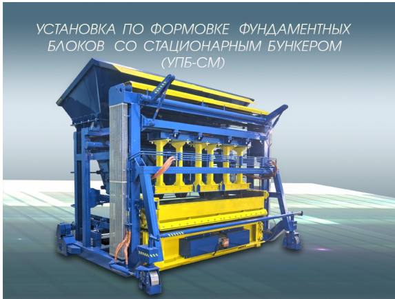
УСТАНОВКА ПО ФОРМОВКЕ ФУНДАМЕНТНЫХ БЛОКОВ СО СТАЦИОНАРНЫМ БУНКЕРОМ (УПБ-СМ)