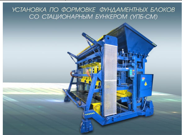
УСТАНОВКА ПО ФОРМОВКЕ ФУНДАМЕНТНЫХ БЛОКОВ СО СТАЦИОНАРНЫМ БУНКЕРОМ (УПБ-СМ)

Строк гарантії: до 18 місяців з моменту відвантаження обладнання.