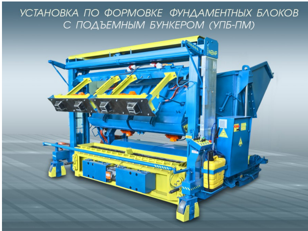
УСТАНОВКА ПО ФОРМОВКЕ ФУНДАМЕНТНЫХ БЛОКОВ С ПОДЪЕМНЫМ БУНКЕРОМ (УПБ-ПМ)