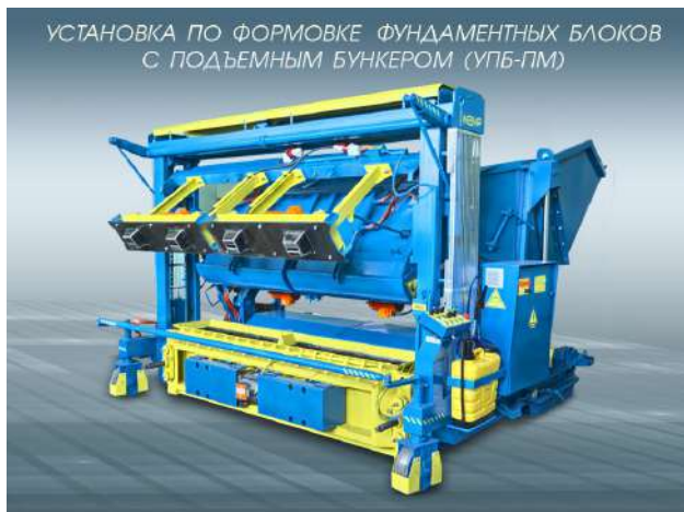
УСТАНОВКА ПО ФОРМОВКЕ ФУНДАМЕНТНЫХ БЛОКОВ С ПОДЪЕМНЫМ БУНКЕРОМ (УПБ-ПМ)